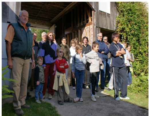
Journée de la randonnée Septembre 2008