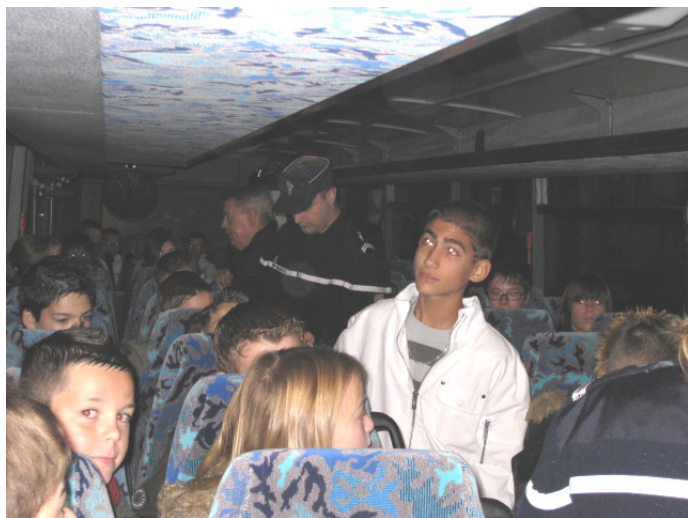
Contrôle du car des collégiens en présence du Maire et de la gendarmerie - Rappel des consignes de sécurité.

LE REPAS DES AINES DE LA COMMUNE A LIEU LE SAMEDI 29 NOVEMBRE A 12H15 A LA SALLE DES FETES